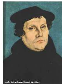
Martin Luther (Luca Cranach der Ältere)

Die frohe Botschaft der Freiheit heißt: Wir sind geliebt, anerkannt, gewürdigt, befreit. Dabei ist es Gott, der Fesseln löst. Das Erste Gebot hält es